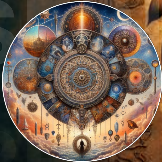
Integratie van de Grote en Kleine Arcana

Volgende sessie gaan we dieper in op de verbinding tussen de Grote en Kleine Arcana.